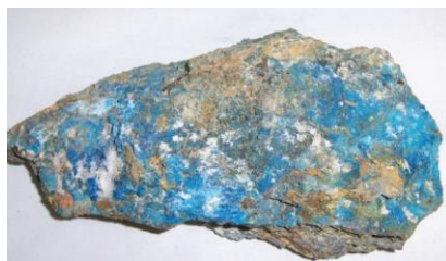
عکس یک نمونه پلماستنگ با سطح دهنج و ازورایت از ساحه بلخاب