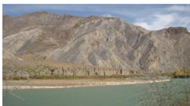
عکس دره عمیق به سمت آبریزه بلخاب

آخرین کار روی معدن مس بلخاب به تقاضای اهالی محل توسط ریاست سروی جیولوجی آغاز شد. یک برنامه سروی مقدماتی نمونه گیری توسط وزارت معادن در سال 2008 اجرا گردید.